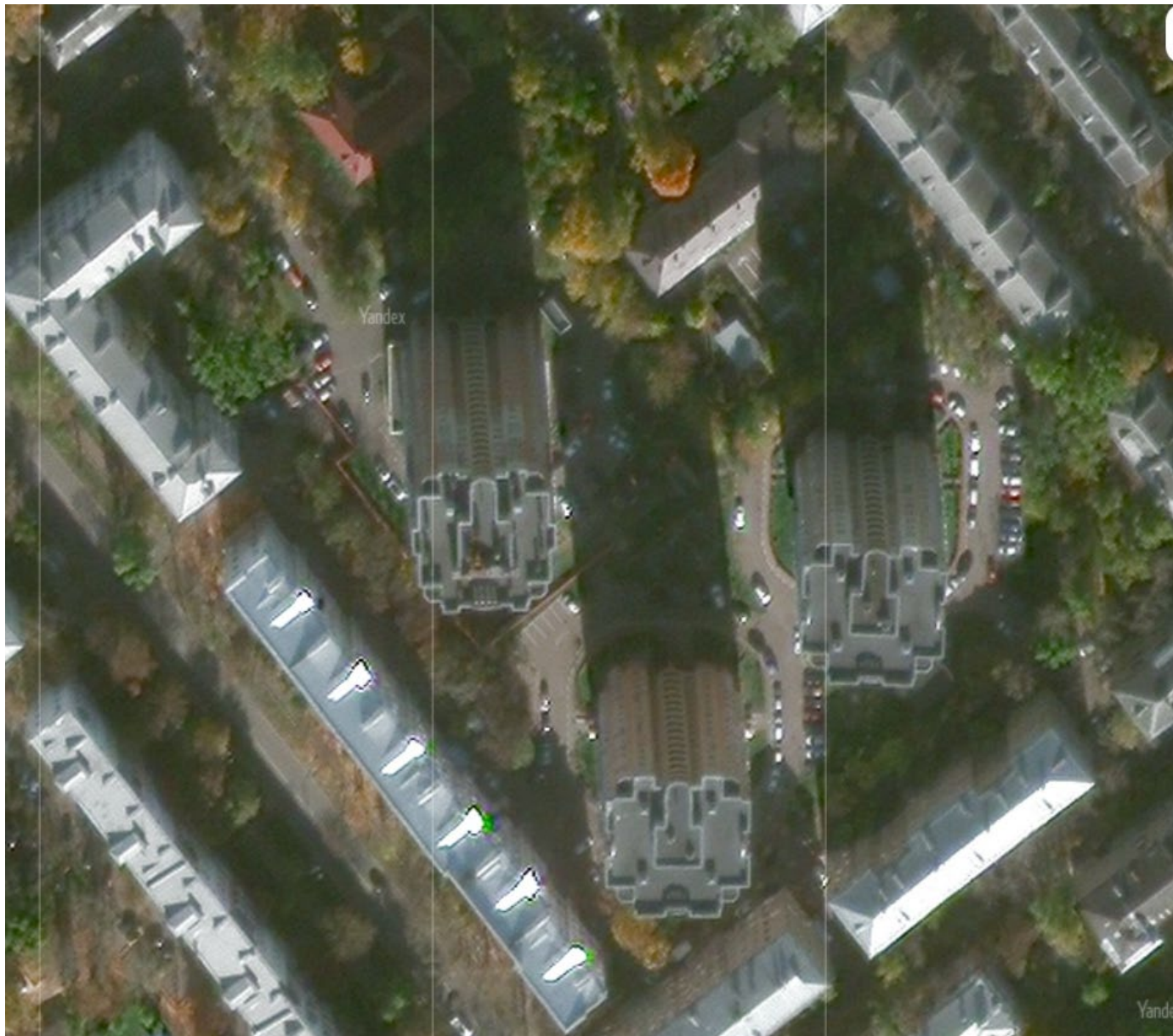
Рисунок 1. Спутниковый снимок объекта